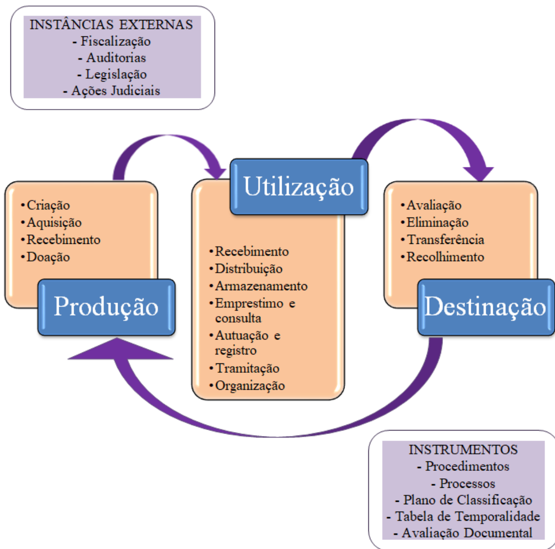
Figura 1 - Modelo de GD do IFS.