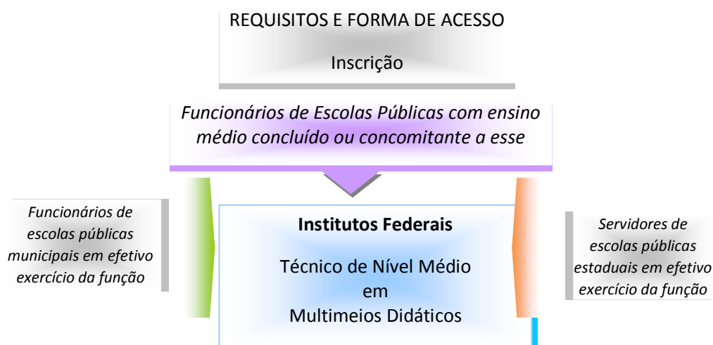
Figura 1 – Requisitos e formas de acesso ao curso.