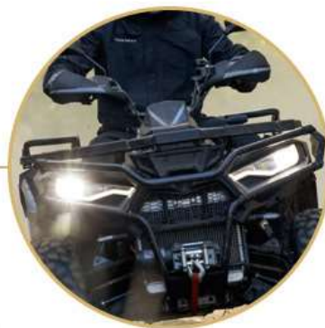
Faróis e lanternas em LED