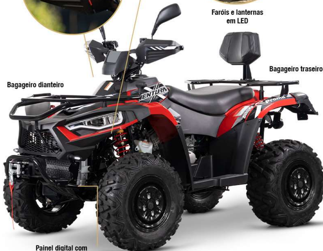
Painel digital com velocímetro, hodômetro e marcador de combustível