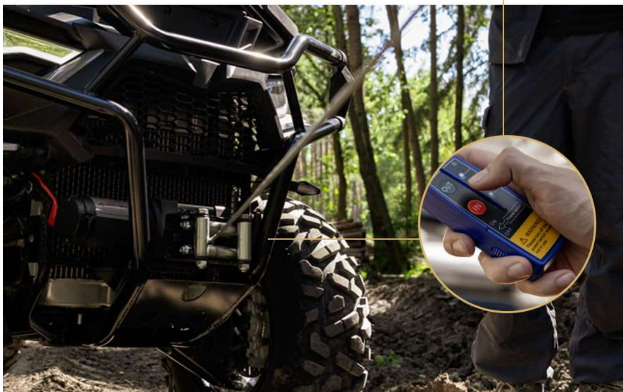
Guincho elétrico com controle