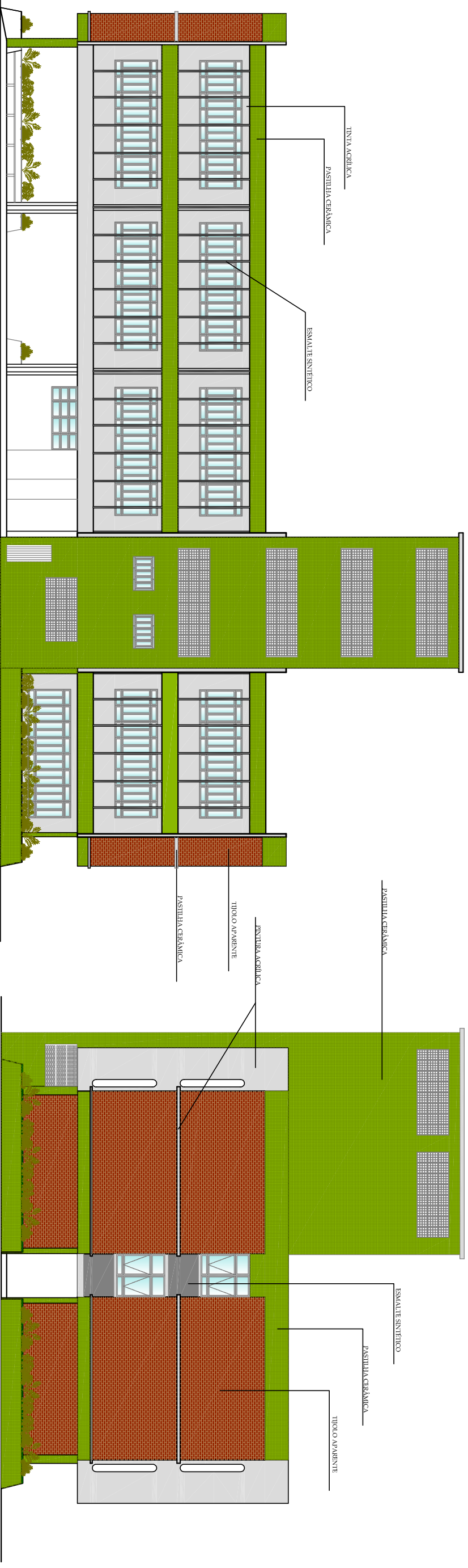
FACHADA NORTE ESCALA 1/200