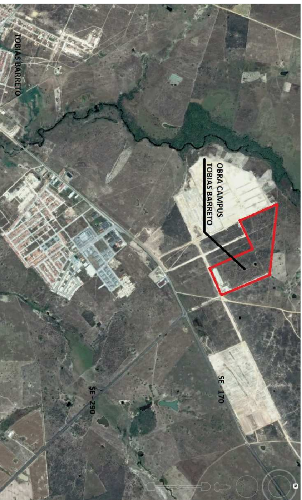
PLANTA DE LOCALIZAÇÃO