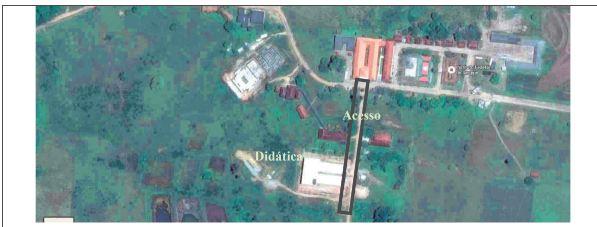
Figura 2. Localização da pavimentação por meio de imagem de satélite.