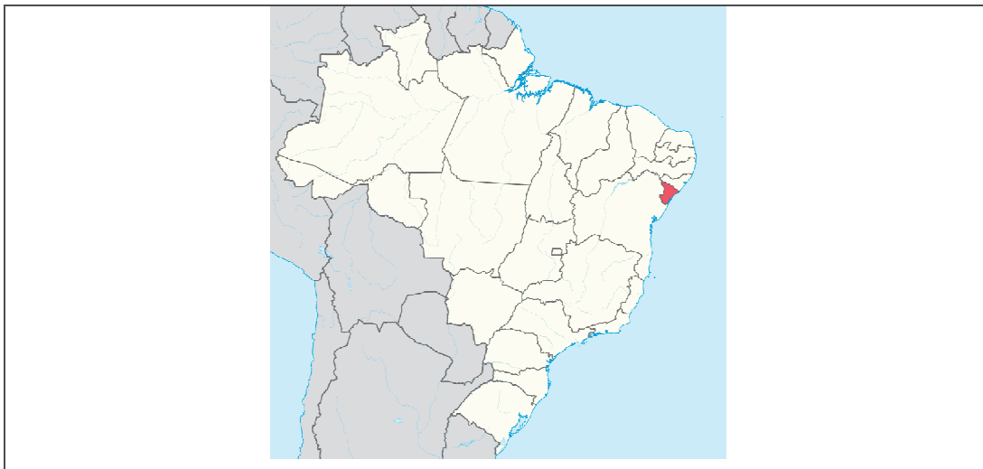
Figura 1. Localização do Estado de Sergipe – Brasil

A Infraestrutura e pavimentação de acesso a Didática do Campus IFS São Cristóvão estão localizados à Rodovia BR-101, S/N, Povoado Quissamã em São Cristóvão – SE, em área interna do próprio Campus.