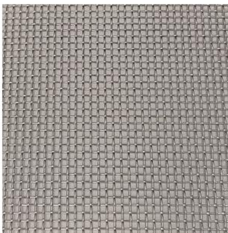
Figura 6 - Tela estuque de aço galvanizado

Para realização do grampeamento, inicialmente deverá remover os revestimentos até acessar a camada da alvenaria, preparar sua superfície com chapisco e inserir a argamassa de regularização com tela de metal (tipo estuque) inserida e devidamente ancorada com grampo formado por aço CA – 60 Ø 4,2mm.