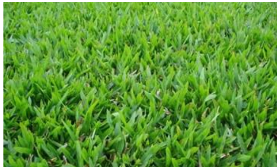
Figura 17 - Grama São Carlos

Antes do plantio da grama, a CONTRATADA deverá afofar a terra, regularizar, fertilizar o solo com mistura de areia e compostos orgânicos e por fim nivelar.