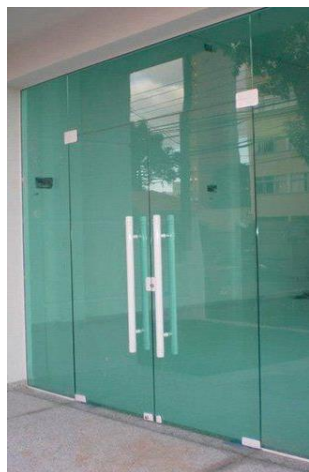
Figura 8 - Porta de vidro temperado

As janelas serão de vidro temperado de 8 mm, de correr, 02 folhas móvel, dimensões de 1,90 x 1,00 m, painel superior (bandeira) de 1,90 x 0,50 m e elementos de fixação (perfis, trilhos puxadores) de metais na cor branca.