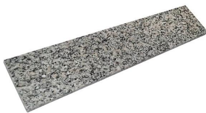
Figura 11 - Granito cinza andorinha