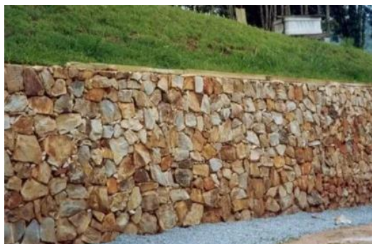
Figura 5 - Alvenaria de pedra argamassada

A alvenaria deverá formar um maciço sem vazios ou interstícios.