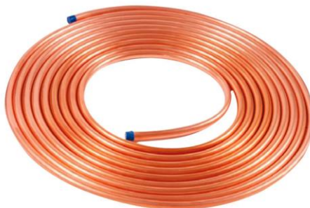
Figura 14 - Tubo de cobre para ar condicionado

A tubulação para a condução do líquido e do gás deverá ser de cobre com diâmetro variando entre 1/4" e 7/8", conforme recomendação de cada fabricante.