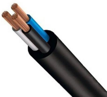
Figura 16 - Cabo elétrico PP - 3 vias

O cabo elétrico deverá ser do tipo PP de 3 vias na bitola recomendada pelo fabricante.