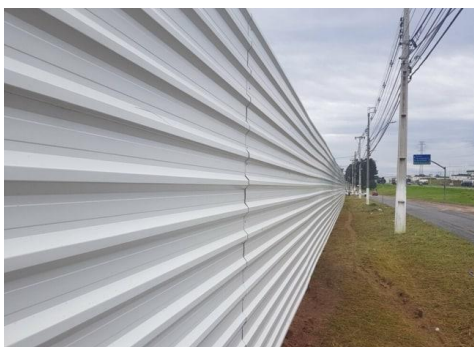
Figura 4 - Tapume com telha metálica

As telhas metálicas deverão ser fixadas em estrutura de madeira (barrote, caibro, tábua) com espaçamento de 2,0m.