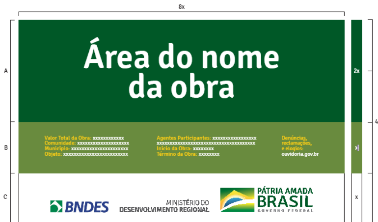
Figura 3 - Placa padrão Governo Federal

A placa de obra terá dimensões de 1,50 x 2,40 m e seguirá o modelo padrão do Governo Federal disponibilizado no endereço eletrônico https://www.gov.br/secom/pt-br/aceso-a-informacao/manuais .