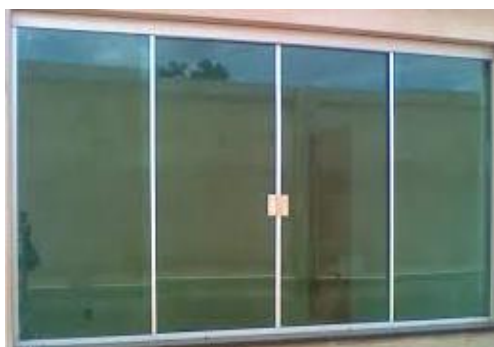
Figura 9 - Janela de vidro temperado

As janelas serão de vidro temperado de 8 mm, de correr, 02 folhas móvel, dimensões de 1,90 x 1,00 m, painel superior (bandeira) de 1,90 x 0,50 m e elementos de fixação (perfis, trilhos puxadores) de metais na cor branca.