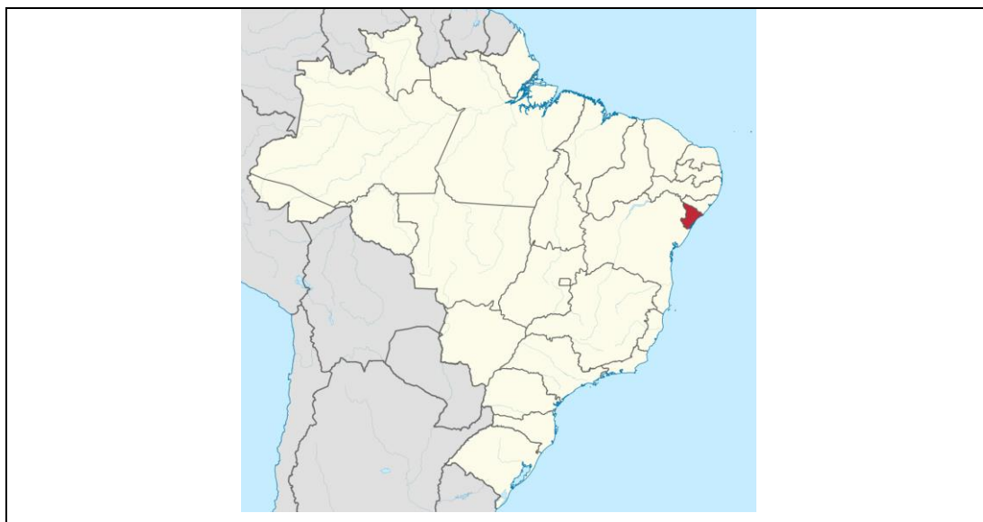
Figura 1. Localização do Estado de Sergipe – Brasil

O campus IFS São Cristóvão está localizado na BR 101 – Km 96, Povoado Quissamã – São Cristóvão/SE.