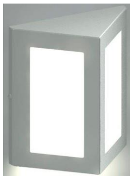
Figura 13 - Arandela de led

No hall de entrada serão instaladas duas arandelas com difusor leitoso, corpo de alumínio branco e lâmpada de led.