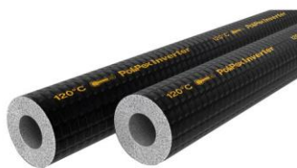
Figura 15 - Tubo esponjoso blindado

Deverão ser instalados, em todos os aparelhos de ar condicionados, drenos em tubo pvc soldável com diâmetro nominal de 25mm (3/4")