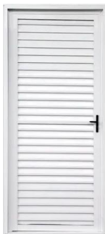
Figura 10 - Porta em alumínio do tipo veneziana