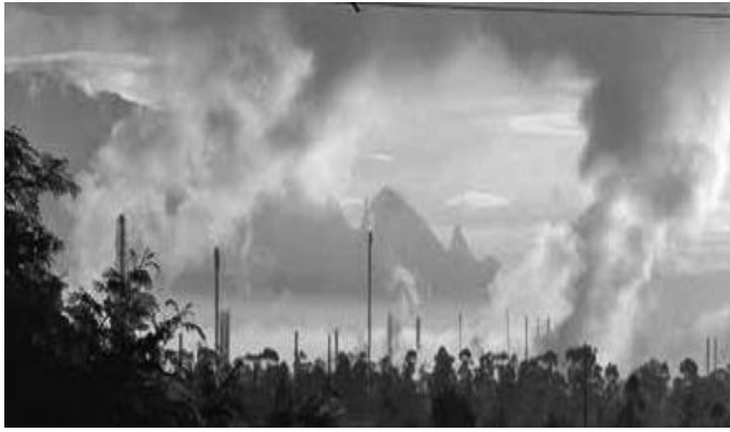
Indústria Petroquímica, Rio de Janeiro