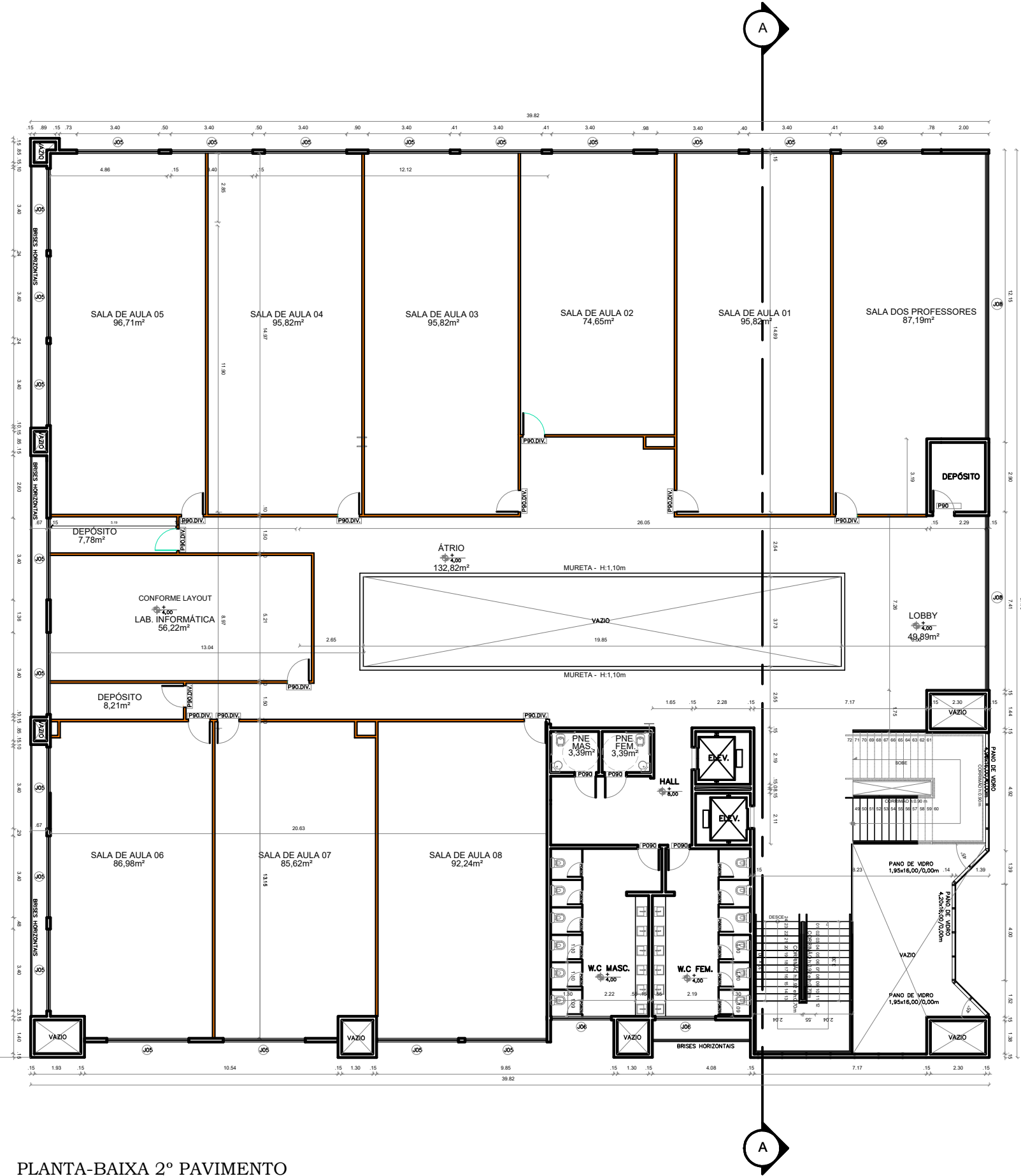
PLANTA-BAIXA 2º PAVIMENTO ADMINISTRATIVO