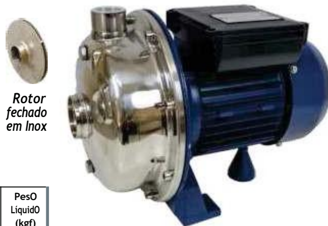
Rotor fechado em Inox

Nota: Sempre consulte a fábrica sobre a compatibilidade dos fluidos químicos a serem bombeados.