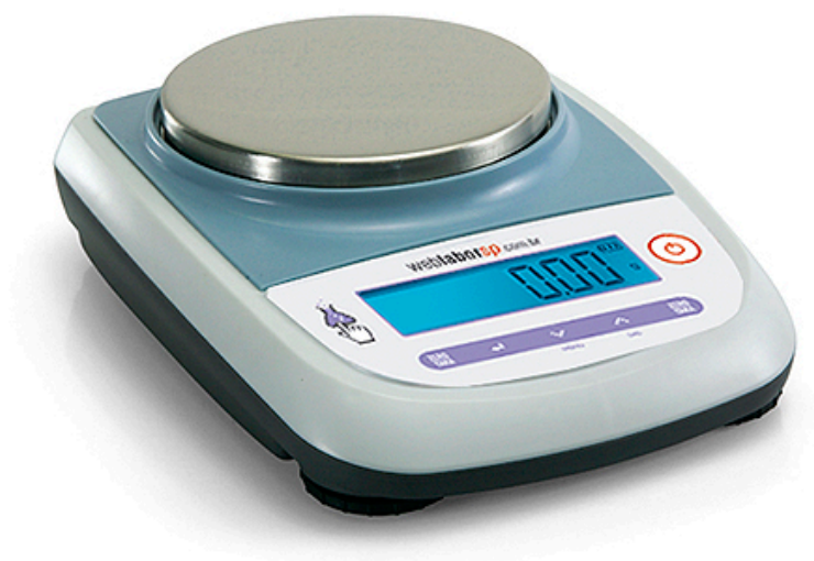
Balança Semi Analítica modelo 4200G 0,01G série S4202