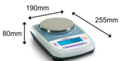
Balança Semi Analítica 4200g