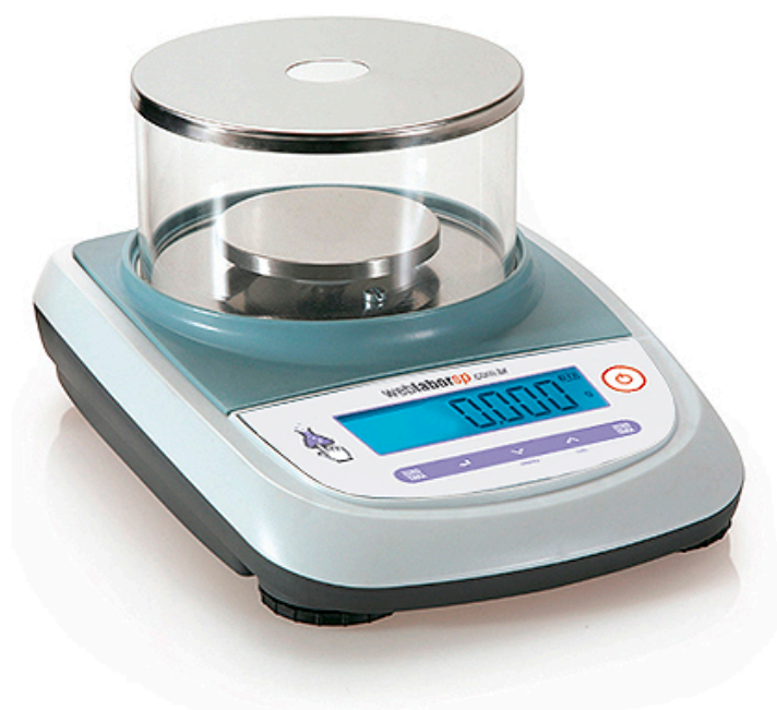
Balança Semi Analítica 210g 0,001g série S203