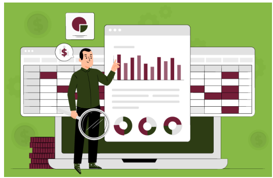
Recuperação de Ativos e Combate à Corrupção e à Lavagem de Dinheiro