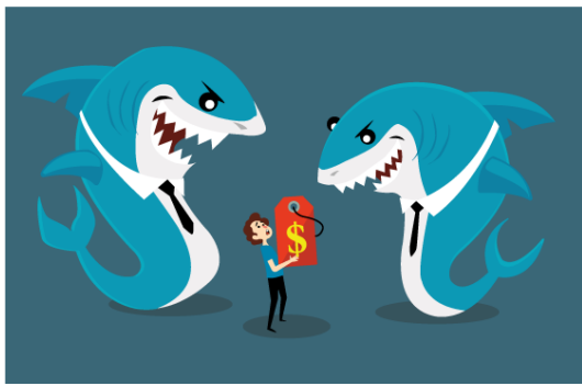
Nova Lei de Licitações: Gestão Contratual