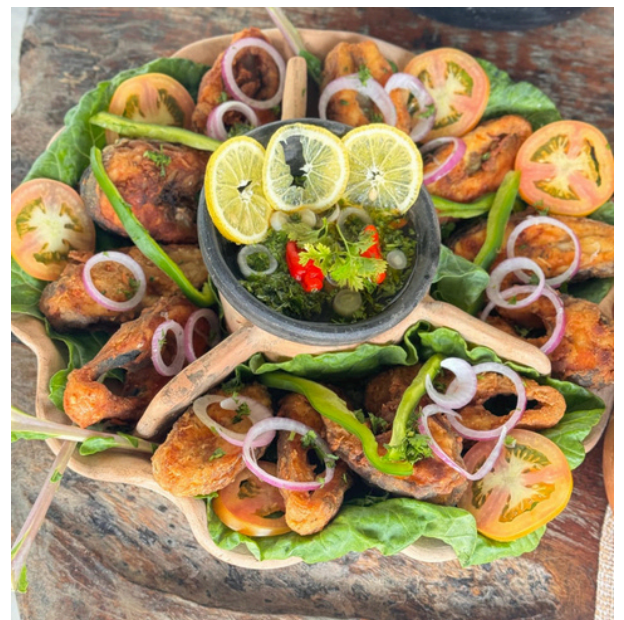
Figura 11: Tilápia frita