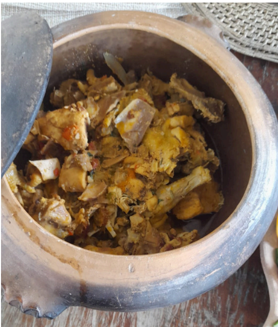
Figura 10: Galinha caipira

Os hóspedes farão suas refeições no Espaço Quissa. Serão ofertados, café da manhã regional, almoço com pratos típicos da roça, jantar regional e lanches em geral.