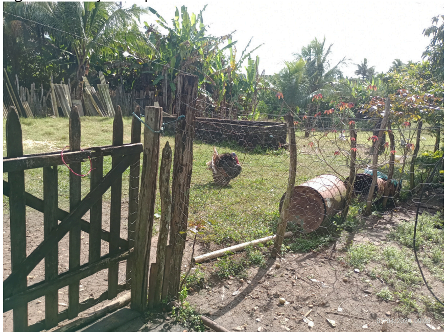
Figura 4: Criação de peru