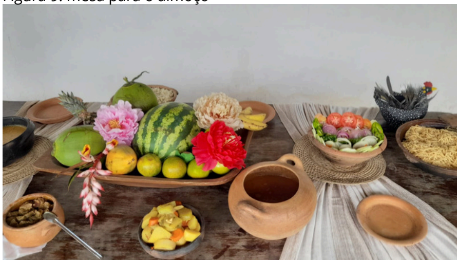
Figura 9: mesa para o almoço

O Espaço Quissa é um estabelecimento comercial gestado pelas assentadas Dedé e Jessiane. É um espaço multifuncional, com o fornecimento de refeições. O local também é utilizado para realização de reuniões comunitárias, festividades e encontros entre assentados e visitantes.