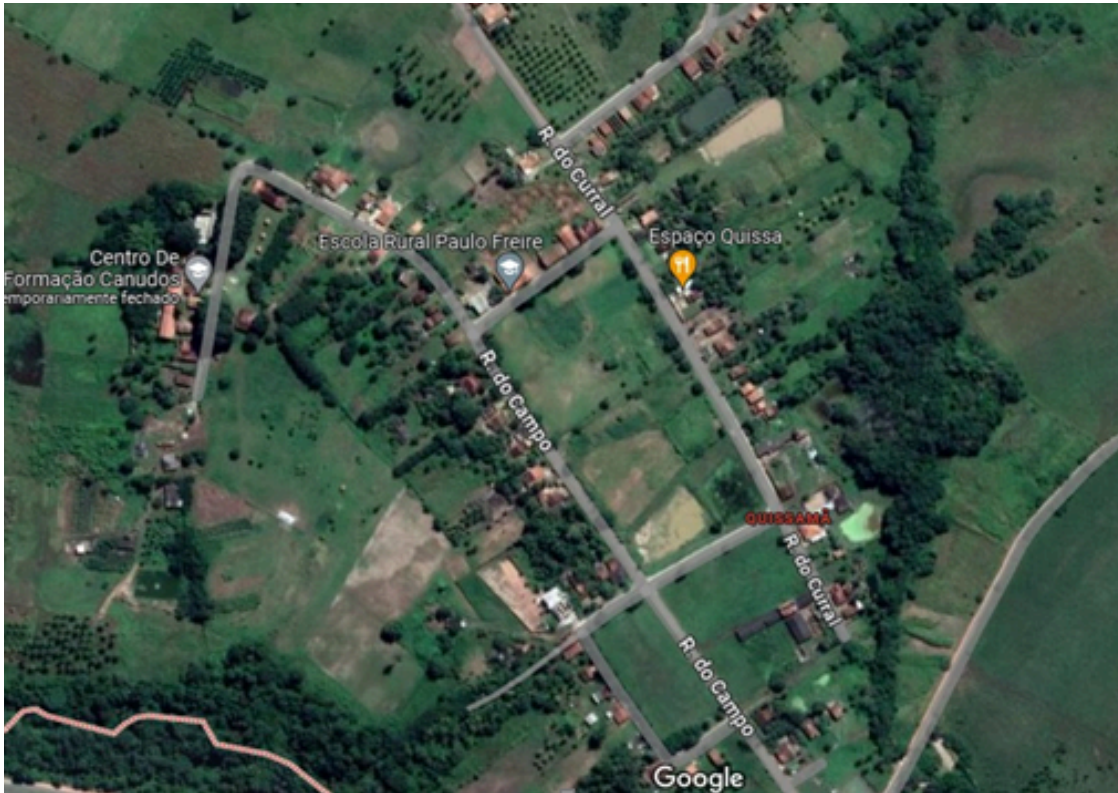
Figura 1: Localização Geoespacial do assentamento Moacir Wanderley, Quissamã, N. Sra. do Socorro/SE