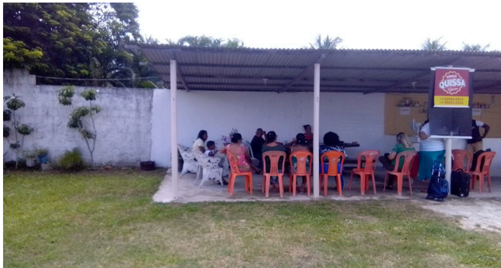
Figura 8: Espaço Quissa