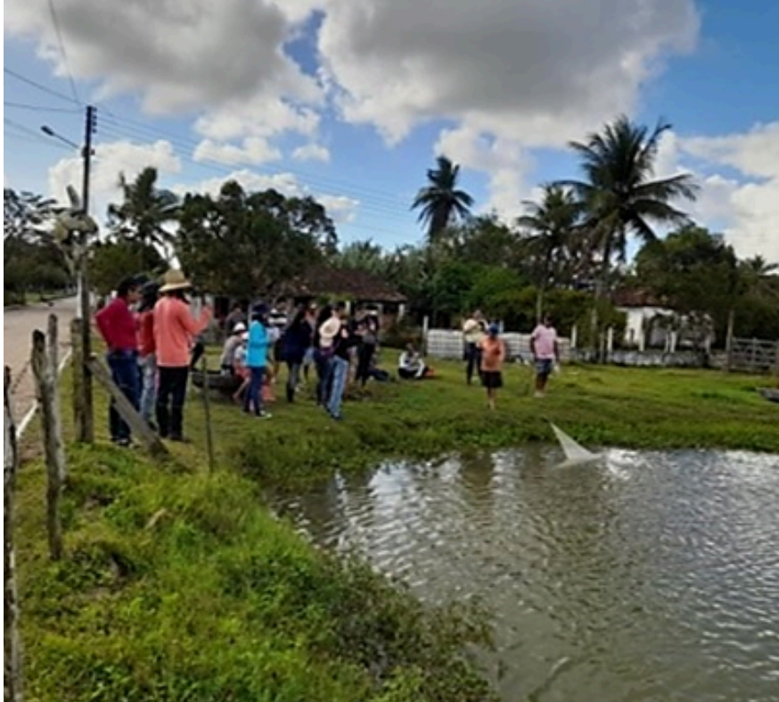
Figura 7: tanque de criação de Tilápia e Carpa