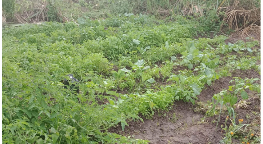
Figura 3: plantação de hortaliças