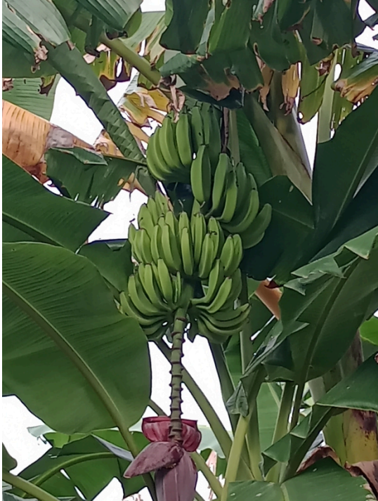
Figura 2: Bananeira